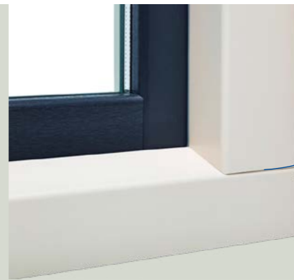
Unieke hout- verbinding look

Walnoot van buiten, wit van binnen? Ploeg kozijnen zijn beschikbaar in verschillende structuren met elk een groot scala aan kleuren. Ook úw ideale kozijn zit er gegarandeerd bij.